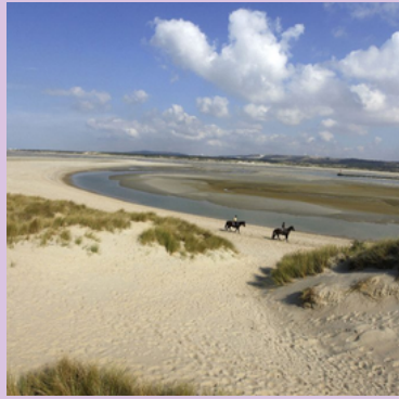
CIRCUITS DE RANDONNÉE