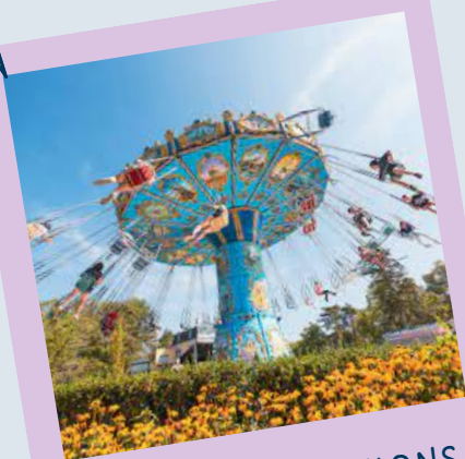
PARC D'ATTRACTIONS BAGATELLE