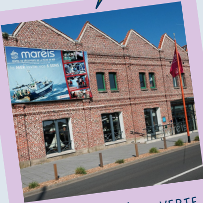
CENTRE DE DÉCOUVERTE DE LA PÊCHE EN MER