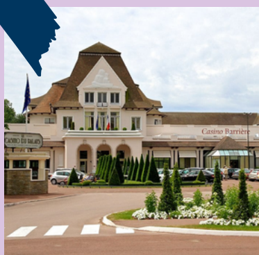
CASINO DU TOUQUET