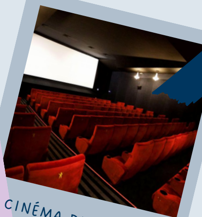
CINÉMA DU TOUQUET