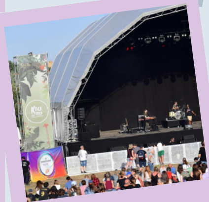
FESTIVAL ANNUEL ROCK EN STOCK