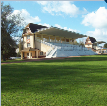
HIPPODROME DU TOUQUET