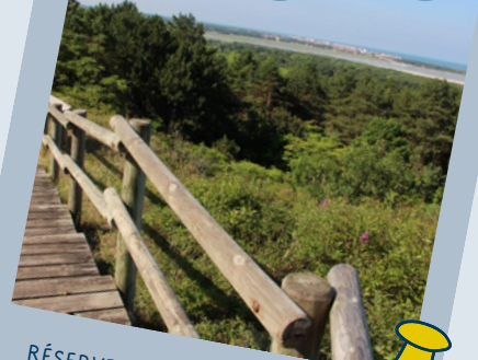
RÉSERVE NATURELLE NATIONALE DE LA BAIE DE CANCHE