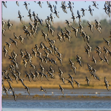
OBSERVATION DES OISEUX