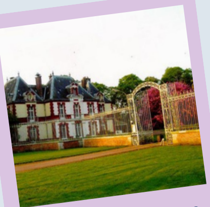
CHATEAU DES LYS