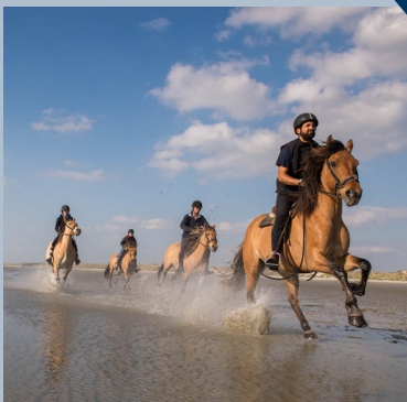
BALADE A CHEVAL