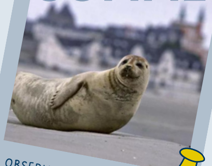
OBSERVATION DES PHOQUES