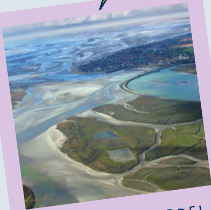
POINTE DU HOURDEL