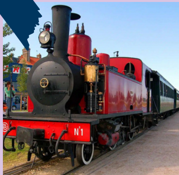
BALADE EN TRAIN À VAPEUR