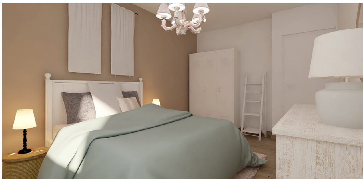
Propositions d'aménagements virtuels non contractuelles